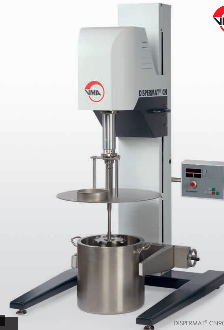
DISPERMAT® CN90 - CN100