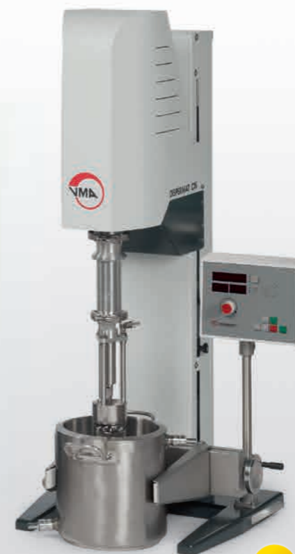
DISPERMAT® CN50 - CN80 with basket mill TML