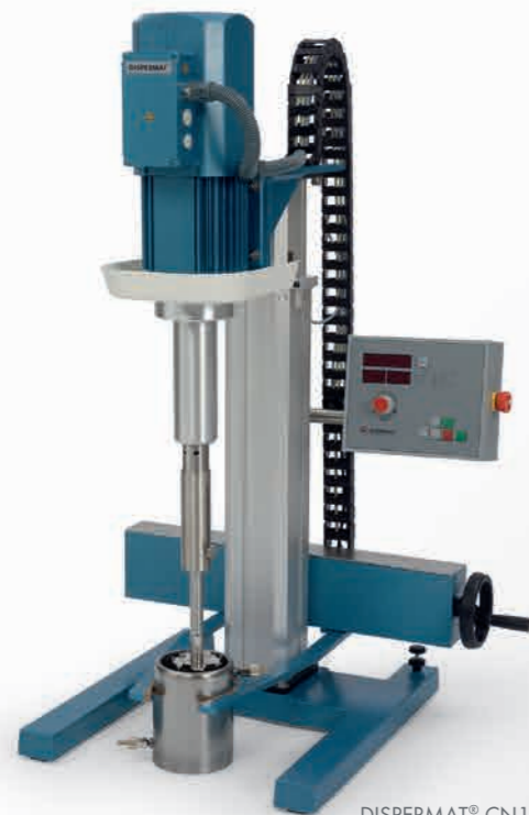
DISPERMAT® CN10 - CN40