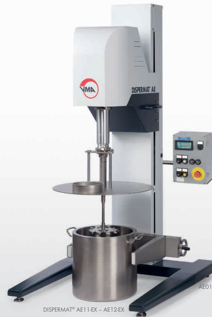
DISPERMAT® AE11-EX - AE12-EX