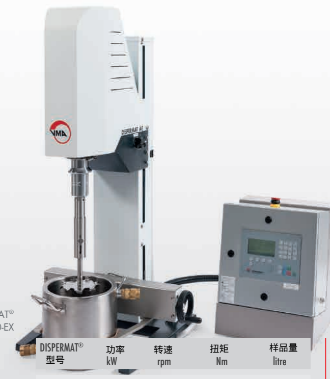
DISPERMAT® AE01-EX - AE10-EX