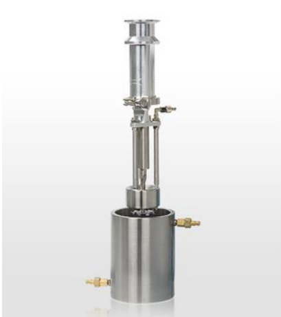
图 1：TML 篮式砂磨系统

即使是高固体含量也能达到很好的研磨效果。处理的样品粘度高达 10000-20000cps。