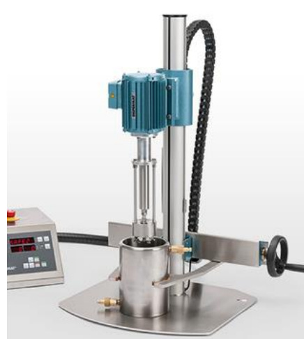
图 2：CV3-PLUS 机型，带篮式砂磨系统